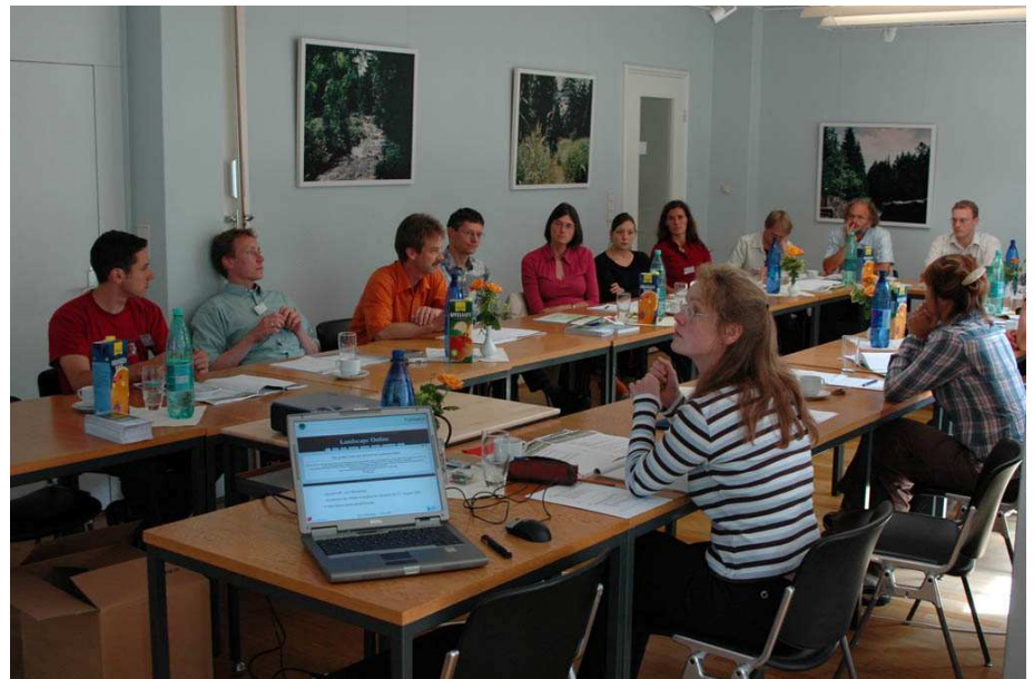
Workshop der IALE-AG Landschaftsstruktur

Die besten Vorträge dieser Tagung sollen in englischer Sprache im neuen IALE-D-Journal „Landscape Online“ veröffentlicht werden. Die Manuskripte werden dort voraussichtlich als Special Issue erscheinen.