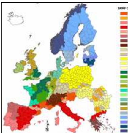
SENSOR NUTS-X Cluster: Kombination aus NUTS-2 und NUTS-3 Regionen für Europa 25+5 (Renetzeder, C.; Eupen, M. van; Mürcher, C.A.; Wrkba, T.2007)

Zunächst wurden in SENSOR die Bedürfnisse der späteren Nutzer des Instruments identifiziert. Die methodische Vorgehensweise der Szenarientwicklung und Landnutzungsmodellierung