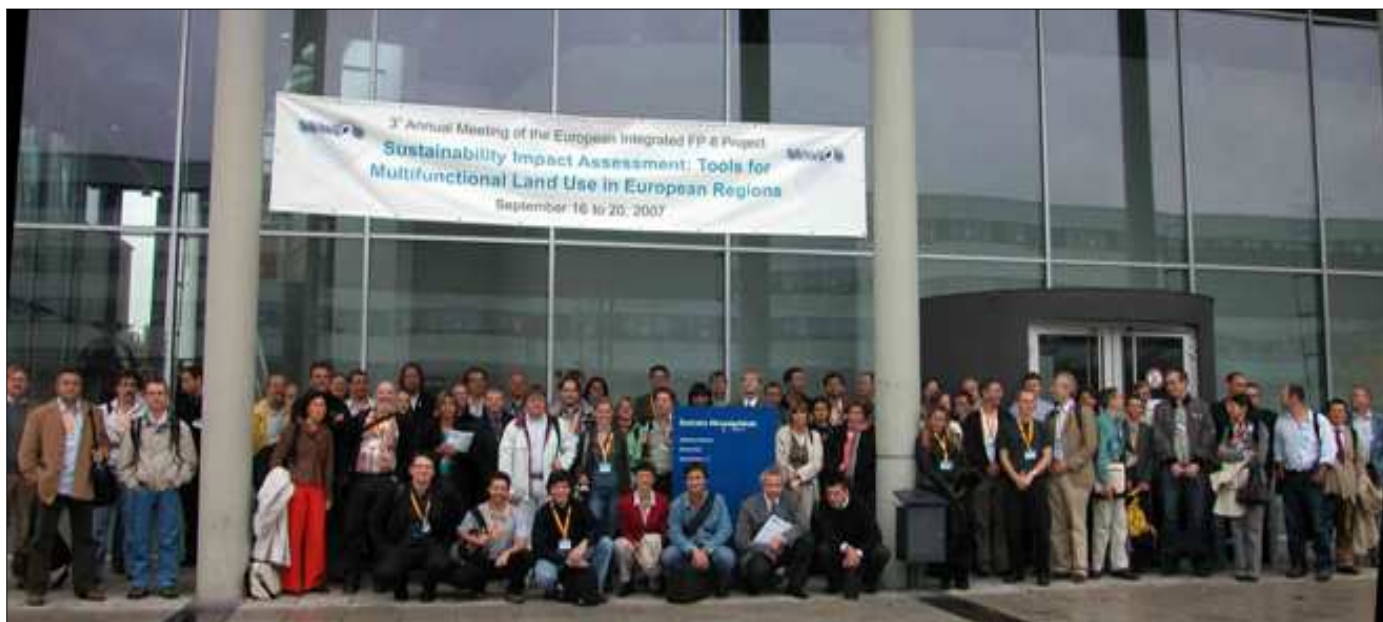
SENSOR Projekttreffen 2007 in Cottbus

Integriertes Projekt im 6. EU Forschungsrahmenprogramm Projektlaufzeit: 2004 – 2008 Projektkoordinatoren: Leibniz Zentrum für Agrarlandschaftsforschung (ZALF) Müncheberg, DE Web: http://www.sensor-ip.eu