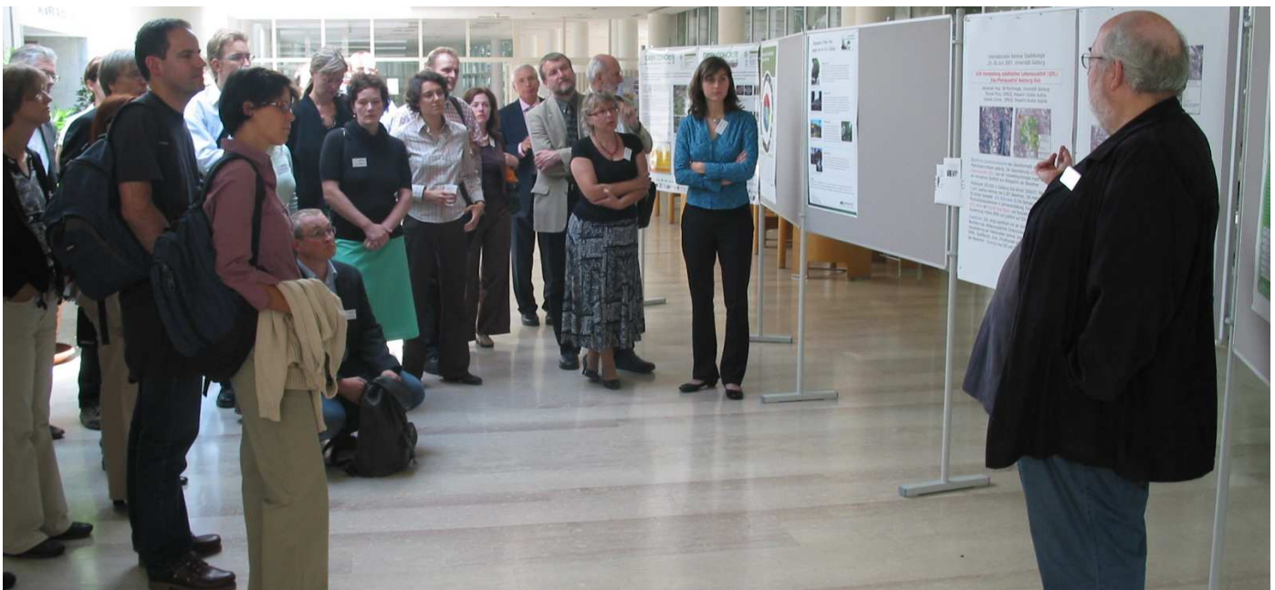
Tagungsteilnehmer bei der Postervorstellung

Die diesjährige Jahrestagung des Arbeitskreises Stadtökologie fand 2006 im Rahmen der Internationalen Konferenz „Qualität der Stadtlandschaft, Indikatoren, Planung und Perspektiven“ vom 29. bis 30. Juni 2007 an der Paris-Lodon-Universität Salzburg/Österreich statt.