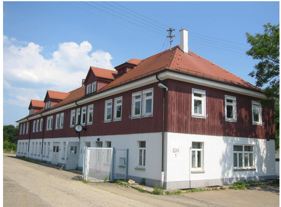
Building for teaching and research

Future usage is still open, but it is aimed at a mixture of leisure, education, information centre and others. In parallel to the development of a future concept by the owner, the Federal Republic of Germany as well as the municipality of Münsingen, the University of Nürtingen together with partners is renting one building from June first 2007 for a (preliminary) duration of three years. The building GN1 can be used for teaching purposes, excursions and research activities. It has 345 m 2 on first floor, consisting of four sleeping rooms and three to four seminar rooms as well as a kitchen, sanitary rooms etc., altogether usable for 25 persons.