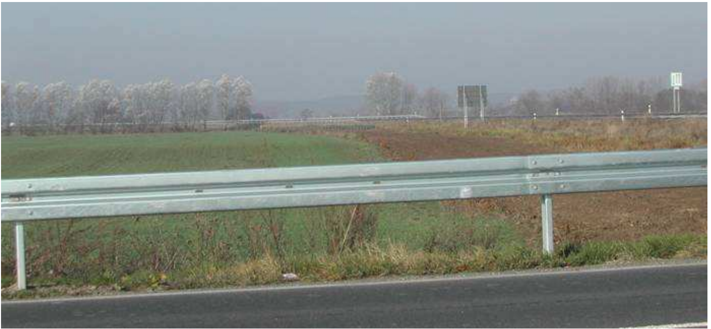
Ein Abschnitt der „Lausitz-Oder-Trasse“, vom damaligen Verkehrsminister liebevoll „LOT“ genannt

3. Die maßgeblichen Beteiligten waren Bürger aller Couleur aus dem Oderbruch. Es kam zu spontanen Solidarisierungseffekten zwischen Alteingesessenen und Neusiedlern, zwischen Bauern, Künstlern und Kommunalpolitikern. Die Initiative „Stoppt die Oderbruchtrassen“ ging von ca. 20 Personen auf einem Loose-Gehöft im Oderbruch aus, bald wurde die Struktur von mehreren Verbänden und Vereinen gebildet, die sich zu den „Bürgerinitiativen gegen die Odertrasse“ zusammenschlossen (Forum Oderbruch, NABU, BUND, Bürgerinitiative Oderbruch). Bis heute ist die zivilgesellschaftliche Dynamik für das Oderbruch einmalig und untypisch.