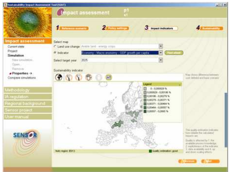
Bildschirmansicht des SIAT-Prototyps aus SENSOR: SIAT ist ein Metamodel zur Bewertung von Landnutzungspolitiken, das den Nutzer interaktiv durch die Modellanwendung führt.

wurde entwickelt und ein Indikatorensystem sowie ein web-unterstütztes Datenmanagementsystem erstellt. Untersuchungen von sensitive Regionen und ein räumliches Bezugssystem für sozioökonomische sowie umweltrelevante Daten wurde entworfen. Die so genannte NUTS-X Karte, die NUTS 2 und NUTS 3 Regionen in einem homogenen räumlichen Gefüge integriert, wurde entwickelt. Aufbauend auf diesen Ergebnissen wurde der erste SIAT-Prototyp entwickelt: SIAT besteht aus 5 Schritten, die den Nutzer durch die Anwendung begleiten. Im 1. Schritt wählt der Nutzer ein vordefiniertes Referenzszenario, welches die Ursachen für Veränderungen in der Landnutzung beschreibt. Im 2. Schritt wählt er die Gebiete der Szenarioprojektion, die von einer Region bis hin zu