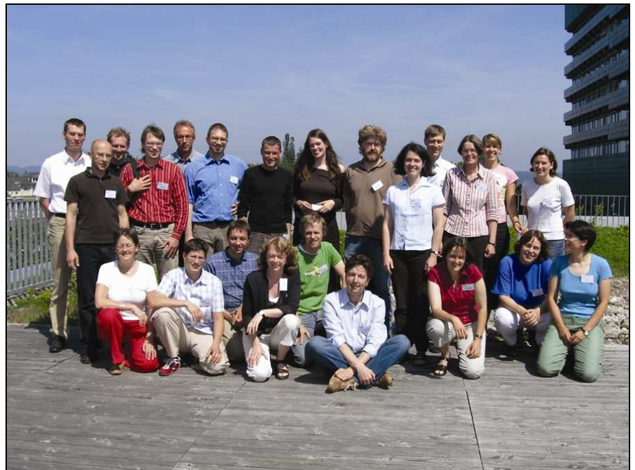
Die Teilnehmer des Workshops "Landscape changes and biodiversity: Landscape ecological research towards sustainable land use in Europe" (Gießen, 23.-25. Juni 2006) des GfÖ-Arbeitskreises Landschaftsökologie.

In den Jahren 2005, 2006 und 2007 organisierte der GfÖ-AK Landschaftsökologie im Rahmen der GfÖ-Jahrestagungen Symposien zu „Driving forces and species diversity at the landscape scale“, „Modelling“ und „Landscape structure and species dispersal“. GfÖ-Mitglieder und -Nichtmitglieder beteiligten sich mit jeweils etwa 10 bis 20 Vorträgen und einer größeren Anzahl von Postern an diesen Symposien. Ein im Jahr 2006 durchgeführter dreitägiger internationaler Workshop zu „Landscape