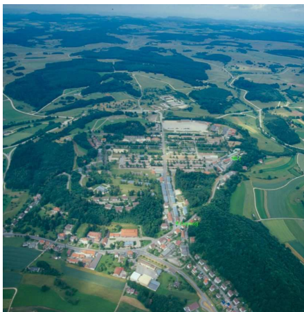
The "Altes Lager" in the heart of the biosphere reserve Swabian Alb

The so-called "Altes Lager" is a former military base, first constructed in 1895, which is under conversion since 2005. It consists of around 120 buildings, from which 90 are under monumental heritage protection (see photograph).